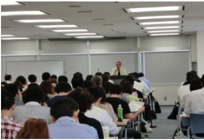
※過去の講義風景です