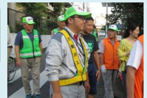
【地元の方と合同パトロール(大東ガス)】

埼玉県ガス協会では、会員各社が協定に基づき、事業活動の中で保護を必要とする方や不審者を発見した際の警察への通報などの取組を積極的に実施しています。