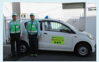
【川口支部の方々と青色回転灯装備車】

また、同組合の川口支部では、平成26年4月から青色防犯パトロールによる地域見守り活動を開始し、平成28年度末までに延べ314回のパトロールを実施し、本年8月、川口警察署長からこの活動に対して感謝状が贈呈されています。この活動のほか、18の支部ごとに児童の登下校時の交通指導をはじめとした見守り活動や事業所でのセーフティステーション活動等を積極的に行い、組合総ぐるみで防犯のまちづくり推進に貢献されています。