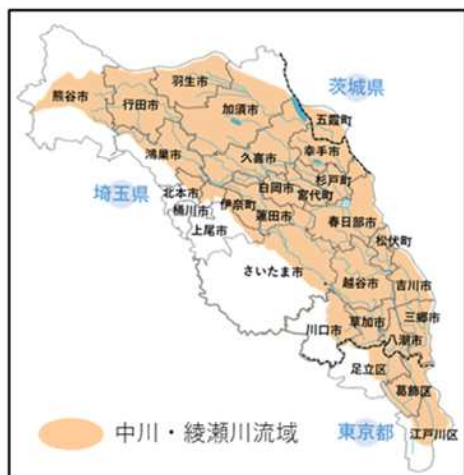
中川・綾瀬川流域を 含む市町（24市町）

令和7年7月1日から、中川・綾瀬川流域においては、特定都市河川浸水被害対策法（以下、「特定都市河川法」という。）が全面的に適用され、流域内の市町において宅地等以外の土地で行う1,000㎡以上の雨水浸透阻害行為（土地の締固めや開発などにより雨水が染み込みにくくなる行為）には、知事等の許可が必要となり、流出雨水量の増加について対策（貯留・浸透施設の設置）を求めます。（特定都市河川法第30条の許可） 許可の窓口は、対象面積や市町により異なりますのでご注意ください。