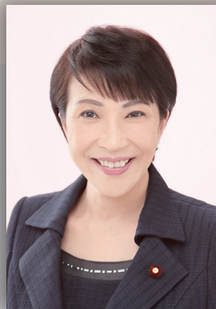
高市 早苗 たかいち さなえ