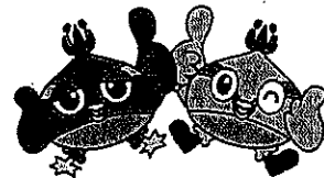
日高市マスコットキャラクター くりっかー&くりっぴー