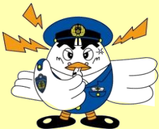
埼玉県警察マスコット ポッポくん

指示通りにATMを操作してください。 キャッシュカードを入れてください。 手続きが上手くいきませんでした。もう一度お願いします。 (何度も操作し、犯人の口座に何度も振り込んでしまう)