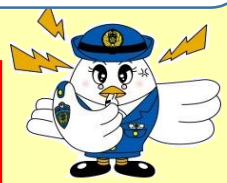
埼玉県警察マスコット ポポ美ちゃん