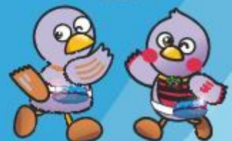
埼玉県マスコット「コパトン」「さいたまっち」

スマートフォンが収納できる ウエストバッグを提供します (青色LEDライト付き)