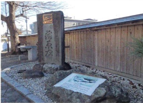
蒲原夜之雪記念碑