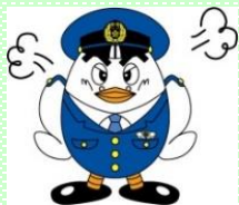
埼玉県警察マスコット ポッポくん

指示通りATMを操作してください。キャッシュカードを入れてください。残高照会をしてください。手続きが上手くいきませんでした。もう一度やり直してください。(言われるがまま操作し、犯人の口座に振り込んでしまう)