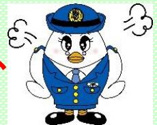
埼玉県警察マスコット ポゴ美ちゃん