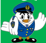
埼玉県警マスコット ポッポくん