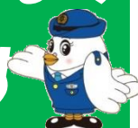
埼玉県警マスコット ポポ美ちゃん