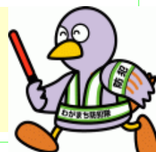
埼玉県のマスコット 『コバトン』

埼玉県住宅課にパンフレット『あなたの住まいの防犯対策』をお求めください。このパンフにより、簡易防犯診断が行えます。