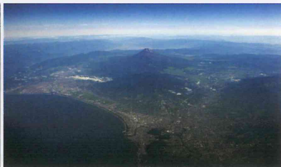
駿河湾と富士海岸、浮島ヶ原