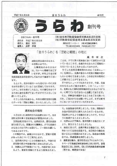
創刊号 (平成 7 年 6 月)

今、ここに 24 年の歳月を経て 87 号の発刊を迎えられるのは代々の広報委員の努力もさることながら会員の皆様のご協力やご理解があったからこそと思います。心より感謝申し上げます。