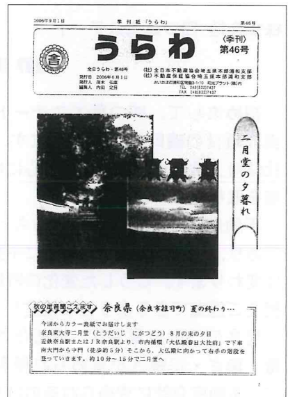
第 46 号 カラー版になりました (平成 18 年 6 月)