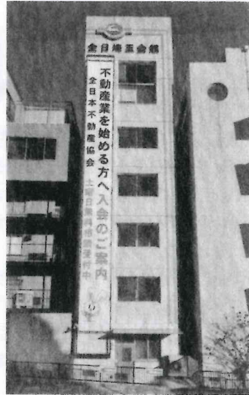
平成 25 年

平成 5 年 7 月に上福岡からさいたま市桜区に移転し、そして平成 24 年 11 月に現住所の全日会館として移転されました。