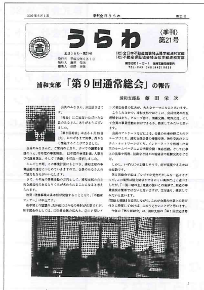
第 21 号 B5判からA4判になりました (平成 12 年 6 月)